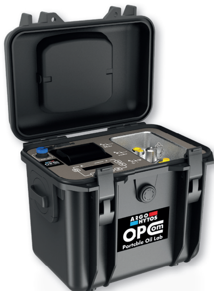
OPCom Portable Oil Lab