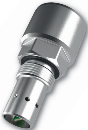
LubCos H 2 O