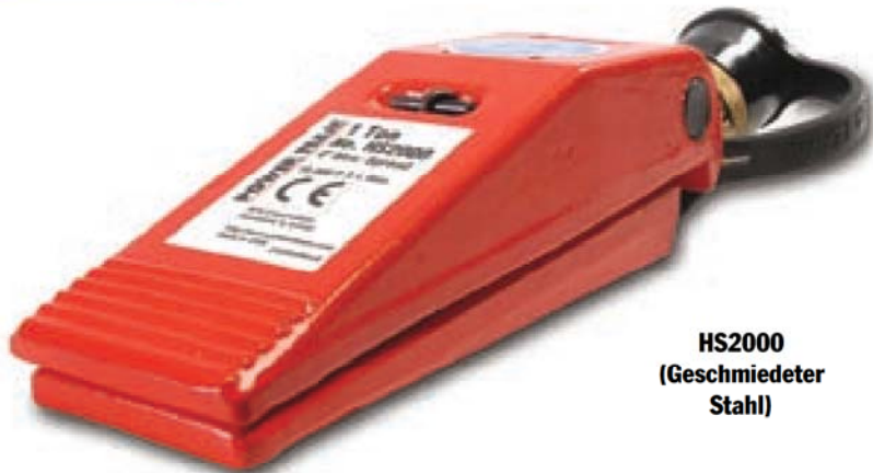
HS2000 (Geschmiedeter Stahl)