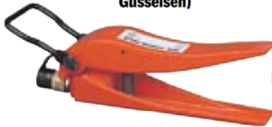
HS3000 (Hochwertiges Gusseisen)

No. HS3000 – 1,5-Tonnen-Spreizer. Effektive Spreizkraft 1.362 kg bei 700 bar, Spreizweite 292 mm. Spreizkraft als vergleichbare Produkte anderer Hersteller. Benötigt nur 30,2 mm Spalt zum Ansetzen der Arme. Kann unter Volllast vollständig bis auf 102 mm Spreizweite ausgefahren werden!