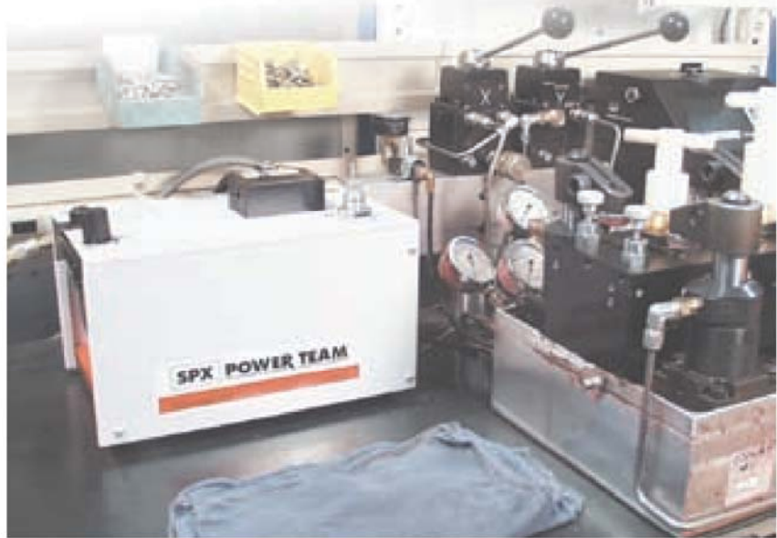
Die PAG0-Pumpe beim Einsatz in einer Spannvorrichtung.