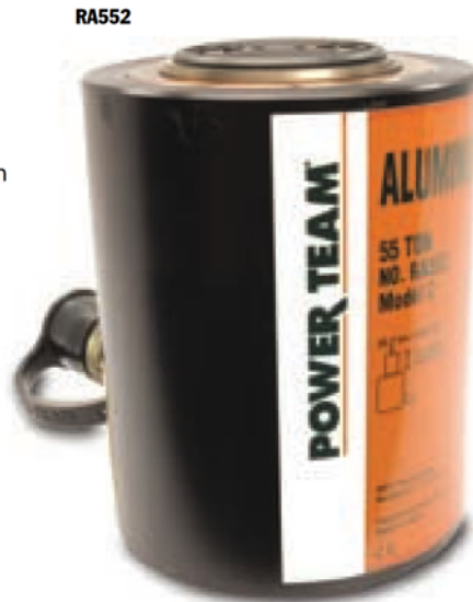
ASME B30.1 700 BAR