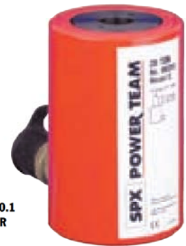
ASME B30.1 700 BAR