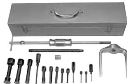
Satz Nr. 981

Mit Hilfe dieses Abziehersatzes können in Sacklochbohrungen eingepresste Lager, Buchsen, Hülsen usw. problemlos ausgebaut werden. Der Satz enthält Spreizeinsätze von 8 bis 44,5 mm Innendurchmesser. Der Spreizeinsatz wird durch die Bohrung des Werkstückes eingesetzt und anschließend mit dem Spreizdorn auseinandergetrieben, bis die Lippen des Spreizeinsatzes fest um das Werkstück greifen. Die Zugkraft wird entweder von einer Spindel mit Brücke oder einem Schlaghammer ausgeübt.